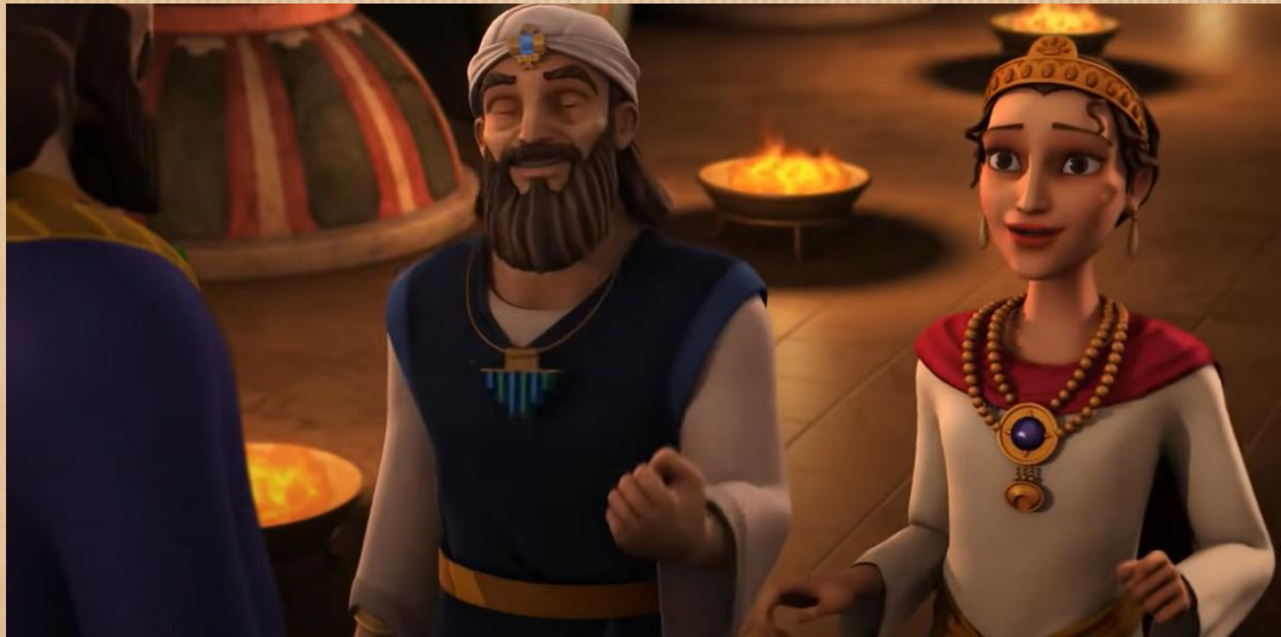
Superbook 勇敢的王后 - 以斯帖與普珥節 https://www.youtube.com/watch?v=JjcR71Eb3UA