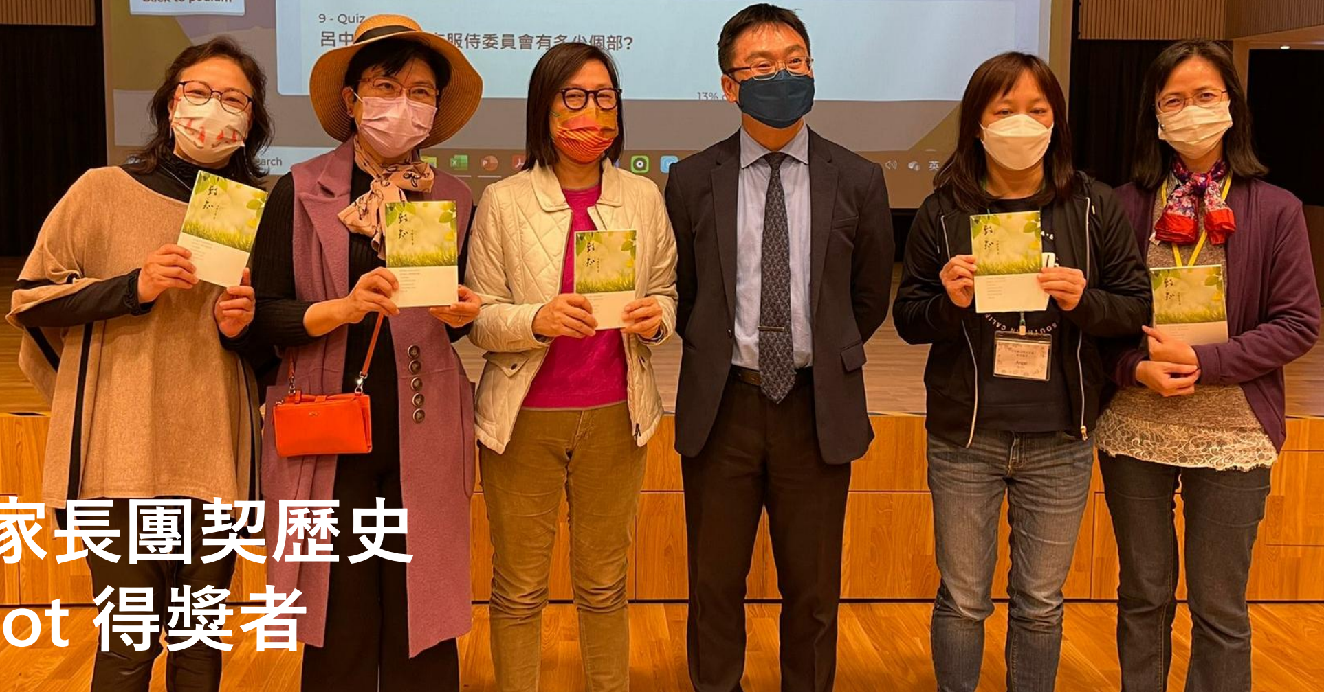
呂中家長團契歷史 Kahoot 得獎者