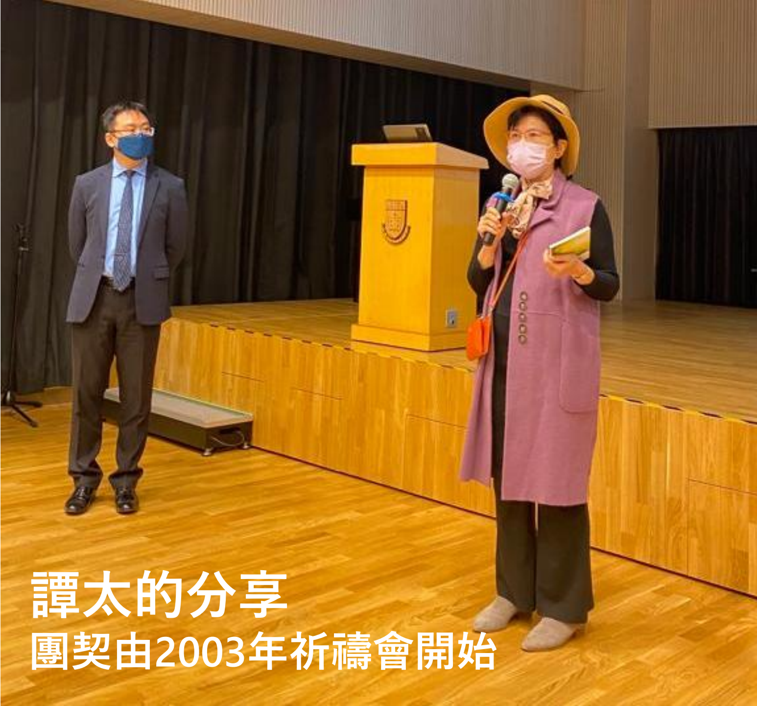
譚太的分享 團契由2003年祈禱會開始