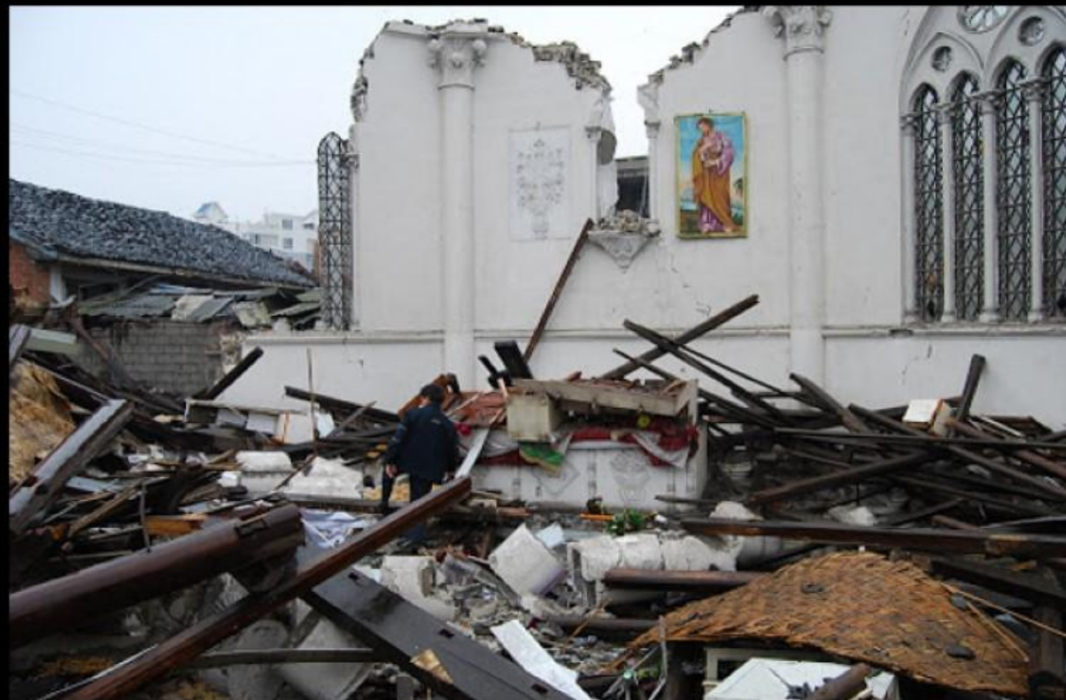
過去一年，全世界八分之一的基督徒為自身的信仰遭受迫害，將近1萬間教堂關閉或遭到襲擊