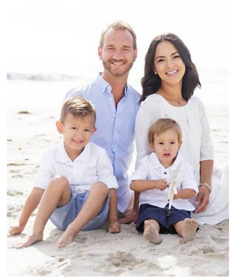
力克·胡哲 Nick Vujicic