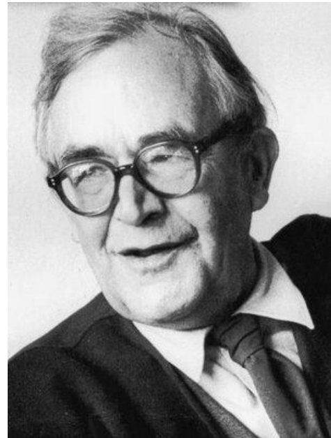
卡爾·巴特 (Karl Barth) 19世紀神學界巨人