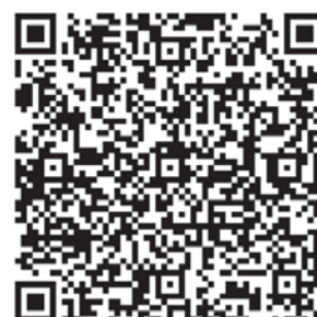
Students' Works and Sharing