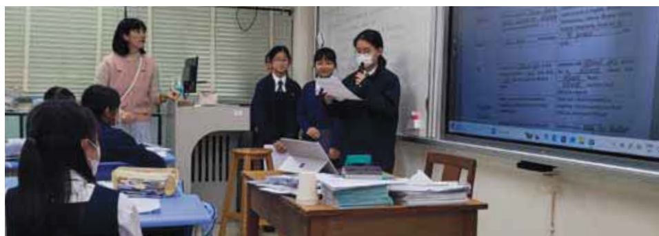
各組同學匯報討論成果