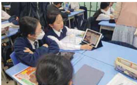
同學在組內展示與匯報預習的成果

總結是次經驗，協作課研確實令我們得益不少，雖然備課、觀課及議課所投放的時間比以往