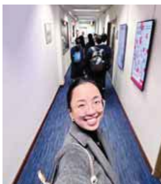
A Field Trip to RTHK

For me, ultimately, to teach Literature is to open a door with the students—a door that does not close with the last page of Wonder , Skellig , or The Diary of Anne Frank . These stories are not destinations, but beginnings to a lifelong journey of understanding, of growth, and of learning to read both the world and ourselves with patience, depth, and a sense of wonder that I hope will linger in our students' hearts long after they leave the classroom.