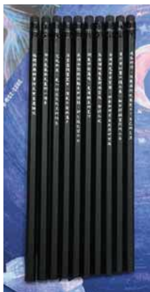
印有文集警句的鉛筆

那天是暑假午後，臨近開學，我在天台花園看花看草看鳥，驀然想起這是她們最後的暑假，想起她們的文字，想起她們的浮沉，便陷入一種悵惘。無論在一地耕耘多久，人走了便是走了，後來的人也不會曉得，某種意義上，這是生命予人的仁慈和寬容，但我仍感覺淡淡的荒涼。我深知這裏只是她們短暫停留的碼頭，我只是她們一小段河道的擺渡人，卻希望不管過了多久，這裏仍有她們的痕跡。於是，一切便這樣開始。