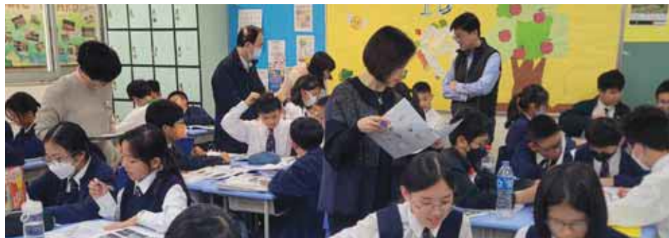
老師在課堂中觀察各組同學表現