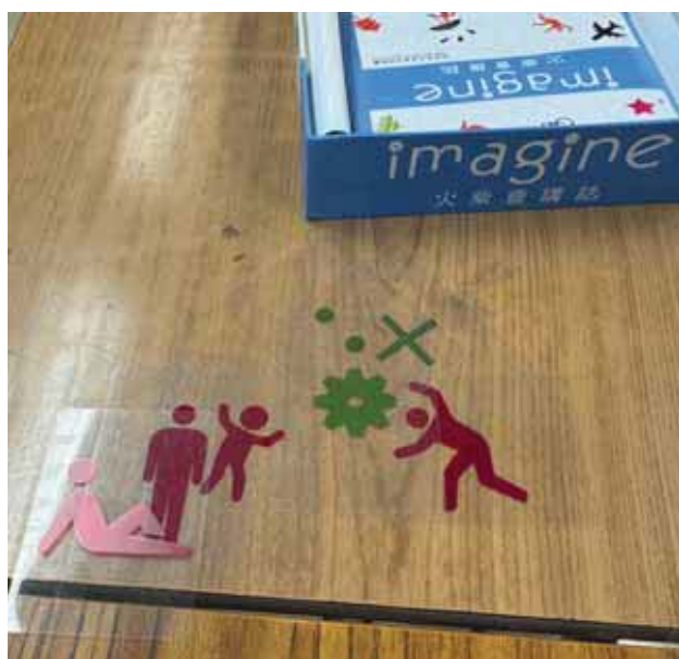
善用教具與實習對象打開話匣子