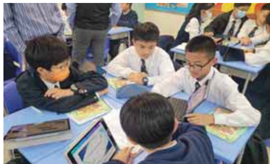
同學利用網上資源進行討論分析