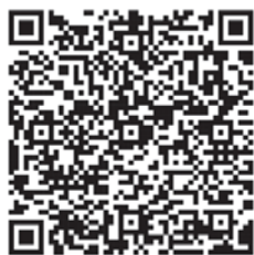
《今晚，月亮也醉了》學生文集 （建議用平板電腦或電腦開啟）