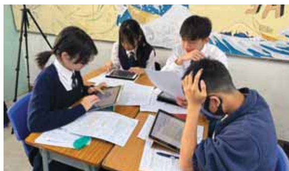
分析其他同學的作品