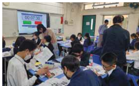
同學利用教材及工作紙進行討論