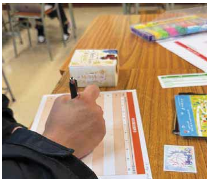
支援學生提升專注力