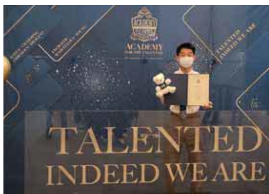
Inauguration Ceremony of HKU Academy for the Talented