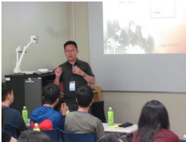
▲專業隨隊導師日本中央研究院副研究員林泉忠教授