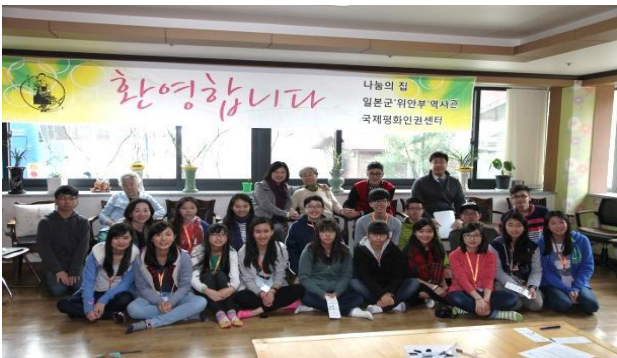
◀訪大韓國日本軍慰安婦歷史館▶