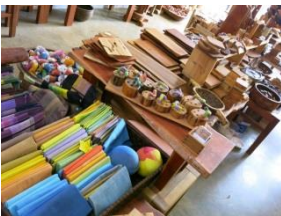
▲Heyri 藝術村內的陶藝品