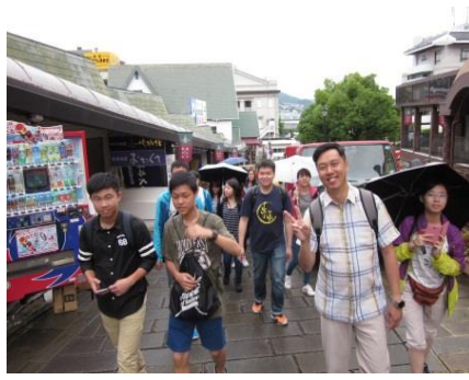
▲前往大浦天主教堂 熊本城▼