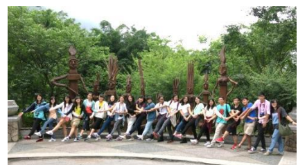
① 太魯閣布洛灣山月村前留影