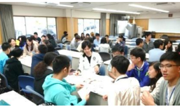
③與名櫻大學學生交流