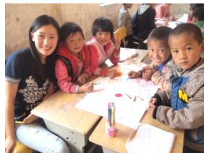
② 麗江堆美小學義教