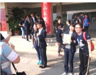
② 與祥雲四中同學交流