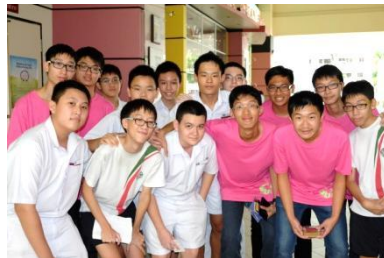
④本校男聲部與武吉班讓政府中學男聲部合照