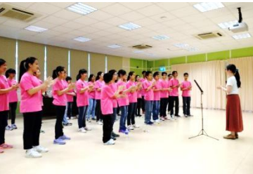
④本校合唱團練習(上)與武吉班讓政府中學同學交流(下)