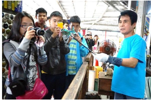
③參觀琉璃村 ③於備瀨村與當地居民交談