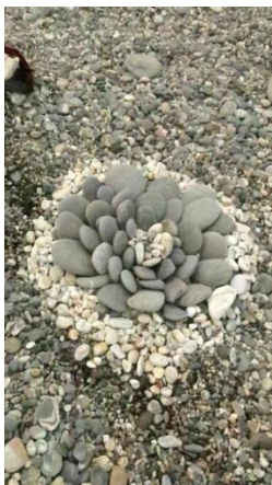
① 七星潭前學生藝術品